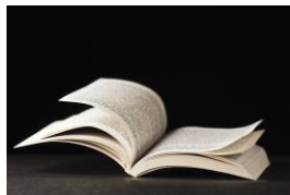
L'instruction interministérielle (publication prévue mi-février 2026)