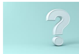
Une foire aux questions